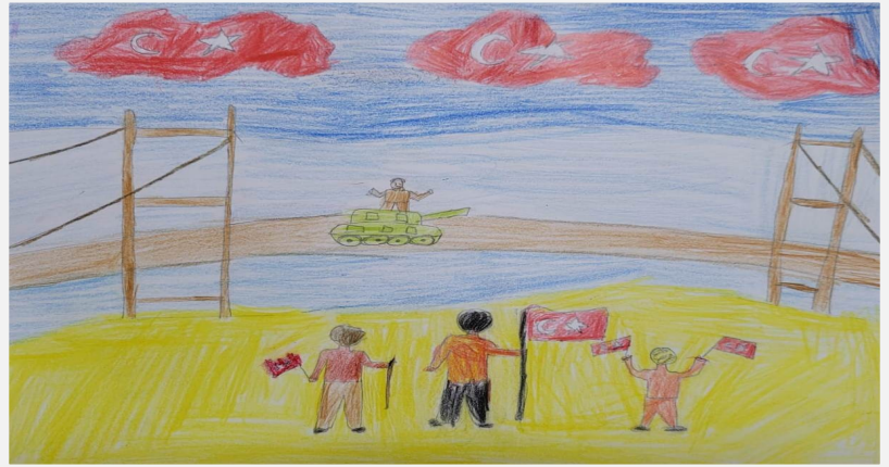
Kerem BULUT 4/B Sınıfı